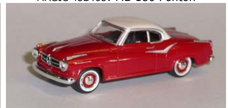
Herpa 24129: Borgward Isabella Coupé