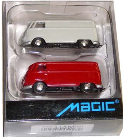
MAGIC 452489: VW T1 Kasten

Kunststoffteile eingesetzt sind. Bei MAGIC sind diese Lichter nur farblich abgesetzt, und verchromte Rückspiegel-Teilchen liegen auch nicht bei.