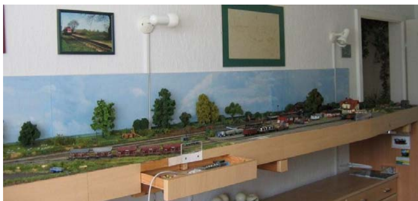
Ansicht des rechten Anlagenteils

Bisherige eigene Veröffentlichungen: EisenbahnMagazin 10/1995 und MIBA 6/2005 .