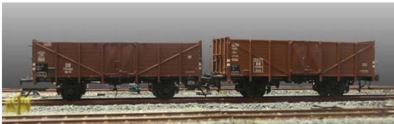
Größenvergleich 1:45 und 1:43,5

Leider war das noch nicht alles, denn einige englische und amerikanische Formenbauer machten sich die Geschichte bei der Umsetzung eines foot in den Bereich der Spurweite 0 doch etwas zu einfach. Sie fanden es sehr bequem, bei der Vermessung ein Viertel Inch (beim Modell) einem foot (beim Original) gleichzusetzen, was dann den Maßstab 1:48 ergibt. Dieser ist auch in den NMRA Standards genormt. So kam es also, dass man in England 1:43,5 baute, in den USA 1:48 und bei uns in 1:45. Wohlgermerkt bei ein und der selben Spurweite von 32 mm.