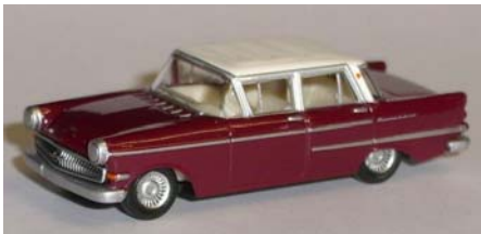
MAGIC 452496: Opel Kapitän

Im MAGIC-Programm erschienen bisher noch weitere Oldtimer, wie z.B.: Porsche 356 C, Audi 60, Auto Union 1000 SP, Alfasud Ti, MB 230 SL Pagode, VW 411 Variant, Ford Taunus P5, Audi 100 L, Audi 60 Avant, DKW Junior, NSU TT, VW - Porsche 914 („Volksporsche“) und der Renault R16.