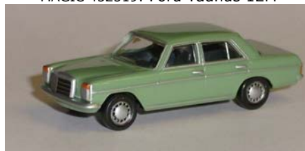
MAGIC 452472: Mercedes-Benz 240 D