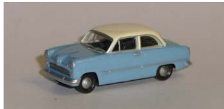
MAGIC 452519: Ford Taunus 12M