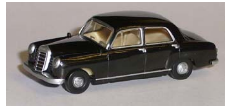
MAGIC 452465: MB 180 Ponton