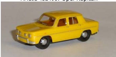
MAGIC 452502: Renault 8 Gordini